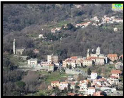
Panorama di Stella San Giovanni