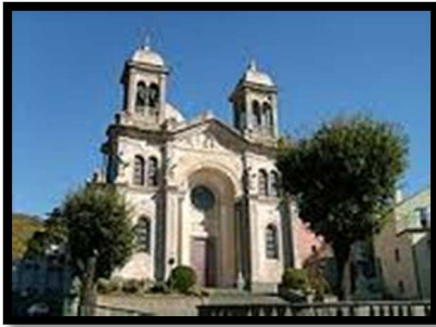
Chiesa di San Giovanni

Il patrono è il santo protettore che si festeggia il 24 Giugno.